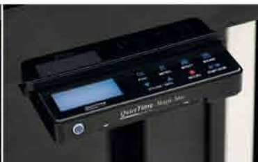
QuietTime Magic Star V6