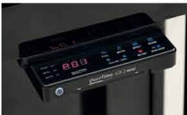
QuietTime GT-2 mini 2